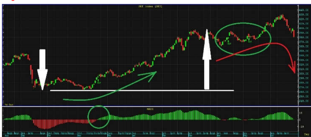
ฟังโอเคแล้วเข้าทำ เลยอยากนำมาฝากทุกท่านครับ

ใครยังงง ลองดูภาพประกอบ สัญญาณซื้อแรกเกิดที่ต่ำ จึงเสี่ยงน้อย มีโอกาสให้ราคาวิ่งได้ไกล ส่วนสัญญาณซื้อ 2 ครั้งหลัง เกิดที่สูงแล้ว จึงเสี่ยงมาก ถ้าพลาดอาจติดคอดยาว